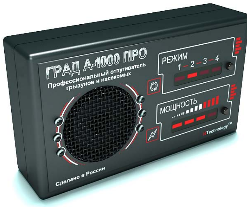
Рисунок 1 – внешний вид прибора