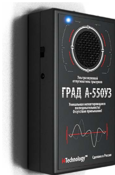
Рисунок 1 – внешний вид прибора