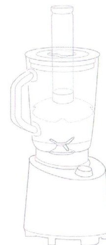
217202 Princess Blender Pro-4 Series Блендер