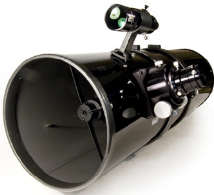
Levenhuk Ra 250N F4 OTA