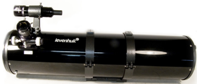
Levenhuk Ra 200N F5 OTA