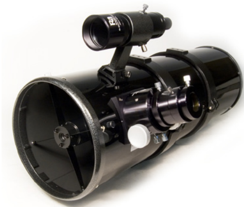
Levenhuk Ra 200N F4 OTA