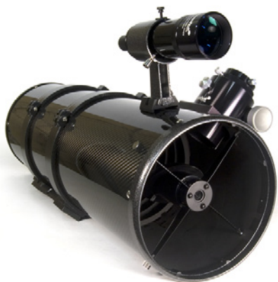
Levenhuk Ra 200N F4 Carbon OTA