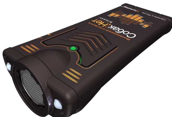
Рисунок 1. – внешний вид изделия