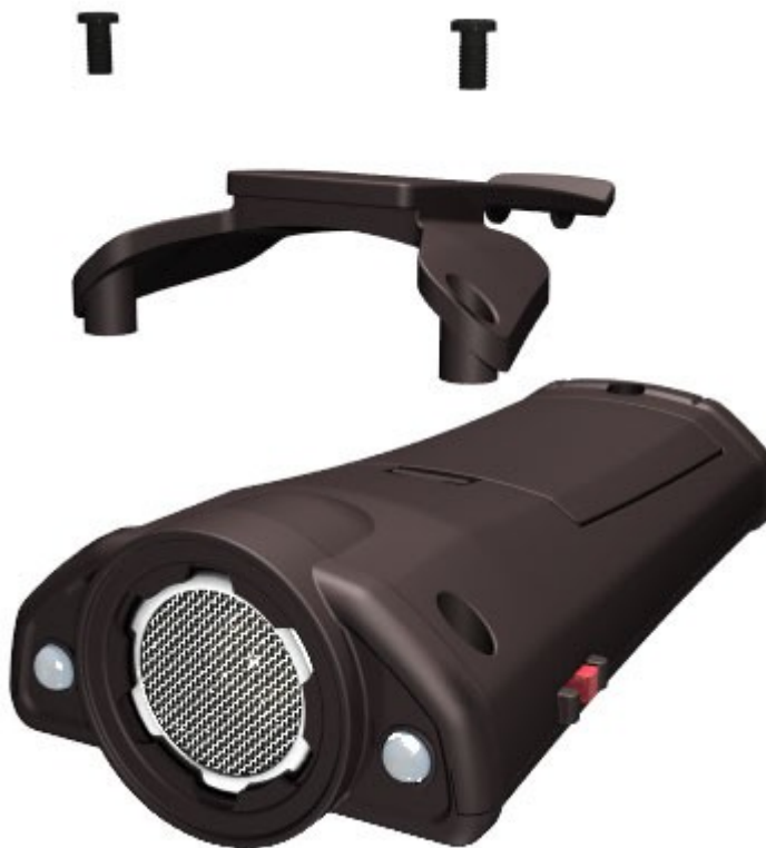
Рисунок 3 – схема установки клипсы

1.4.3 Клипса (поз. 8 рисунок 2), предназначенная для возможности закрепления изделия на пояском ремне, в состоянии поставки не установлена на корпусе изделия и может быть по желанию установлена самим пользователем, для чего в комплекте с изделием поставляются два самонарезающих винта увеличенной длины, которыми нужно заменить имеющиеся в корпусе. Схема установки клипсы представлена на рисунке 3.